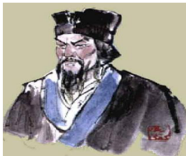
商鞅在秦国主持变法