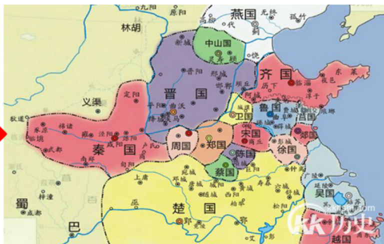
战国时期的诸侯国