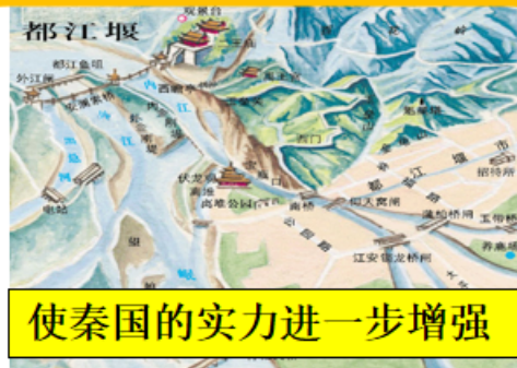
使秦国的实力进一步增强