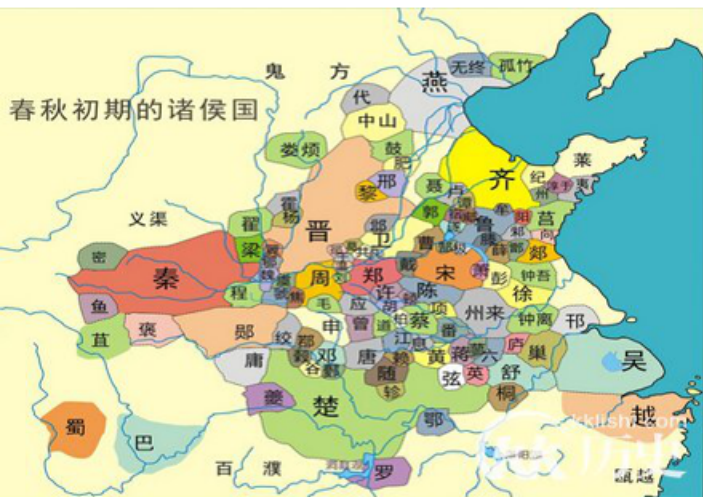
春秋初期的诸侯国