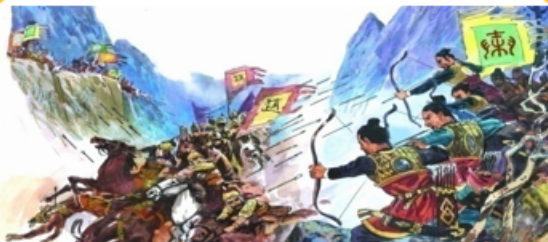
表明秦军已具备统一全国的实力